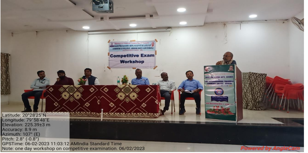
Latitude: 20°28'25"N Longitude: 79°58'48"E Elevation: 225.39±3 m Accuracy: 8.9 m Azimuth: 107° (E) Pitch: 2.8° (-0.8°) GPSTime: 06-02-2023 11:03:12 AM India Standard Time Note: one day workshop on competitive examination. 06/02/2023