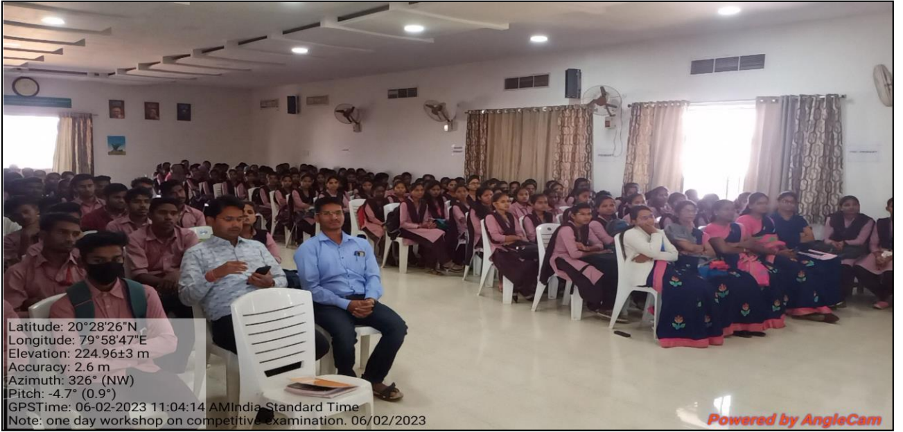
Latitude: 20°28'26"N Longitude: 79°58'47"E Elevation: 224.96±3 m Accuracy: 2.6 m Azimuth: 326° (NW) Pitch: -4.7° (0.9°) GPSTime: 06-02-2023 11:04:14 AM India Standard Time Note: one day workshop on competitive examination. 06/02/2023